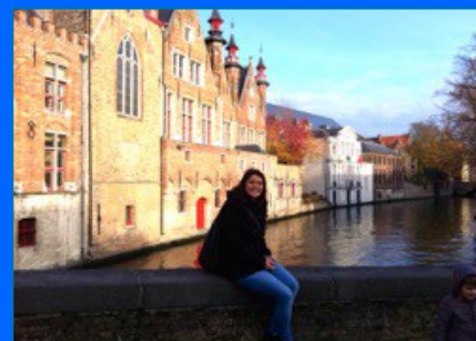
PHOTO-GALLERY DEL MIO VIAGGIO NELLA CAPITALE D'EUROPA